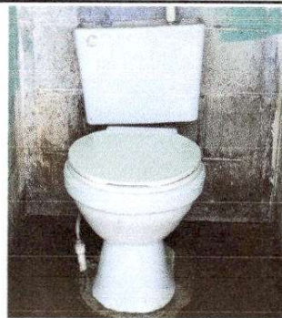
FOTO 4: SUSTITUCION DE TECHO, CAMBIO DE TAZAS, LAVAMANOS Y PINTURA.