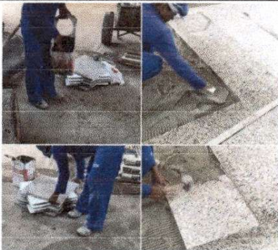
FOTO 3: SUSTITUCION DE TORTA DE CEMENTO POR PISO DE GRANITO AULAS DEL MODULO 1.