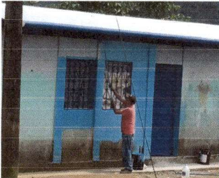
FOTO 1: CUBIERTA DE LAMINA, SUSTITUCION DE LAMINA POR LAMINA TROQUELADA ALUMINZINC CALIBRE 26